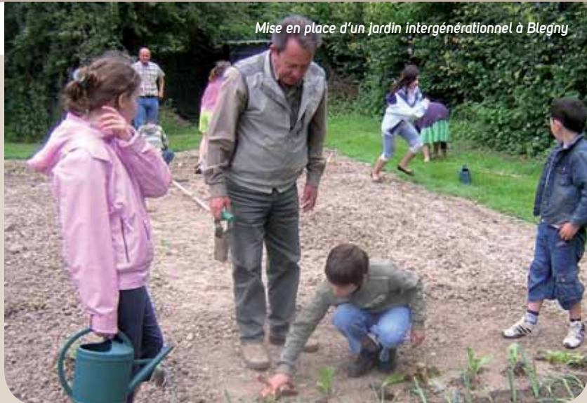
Mise en place d'un jardin intergénérationnel à Blegny

« Le PCS proposé par la commune, doit être en accord avec ce diagnostic et celui mené en concertation avec les agents locaux de