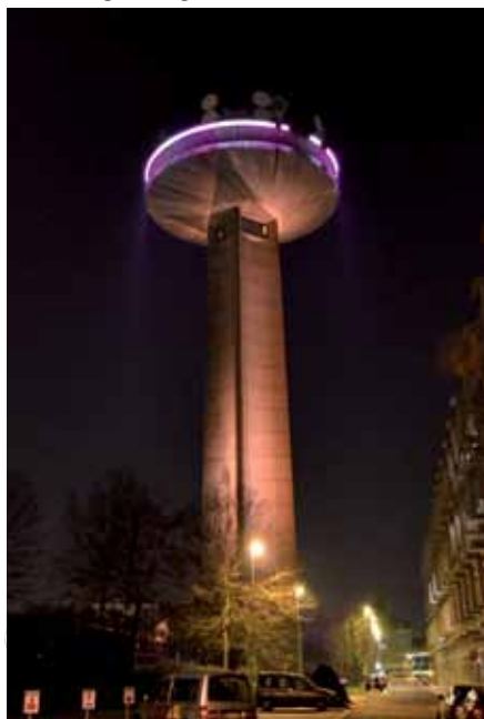
La tour Reyers, siège central de la RTBF