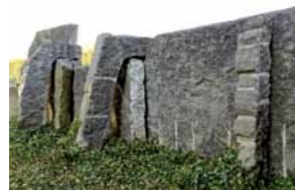
Le fruit du mur, œuvre de Pierre Culot aux Moulins de Beez, 1998

Depuis 1993, la Commission des Arts de la Région wallonne mène une politique volontariste d'intégration d'œuvres d'art dans les bâtiments régionaux. A son bilan, l'intégration d'une trentaine d'œuvres qui explorent les grands courants de la création contemporaine tout en étant conçues spécifiquement pour les lieux qui les abritent.