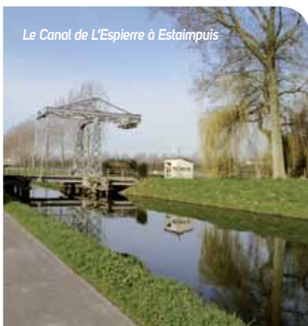
Le Canal de l'Espierre à Estaimpuis

Havre de paix pour les promeneurs, il a été classé au patrimoine wallon en 2000. Mais, les bous accumulées au fond de son lit l'avaient rendu impraticable à la navigation depuis 1985. Débarrassé d'une partie des ces sédiments, le canal entame aujourd'hui sa reconversion des deux côtés de la frontière grâce au programme européen de travaux baptisé « Blue Links » qui s'attèle notamment à la remise en navigation de la liaison Deûle-Escaut. Cette réouverture vient compléter les 20 000 km de réseau navigable en Europe du Nord-ouest, réseau permettant de relier la Tamise à la Meuse, Amsterdam au Canal du Midi.